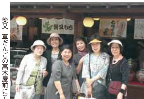
柴又草だんごの高木屋前にて

色は迫力があつた。お約束のガラス床乗りに挑戦した岡会長。「お願い！手を握って！」と痛いほど掴まれた指は骨が砕けそうになった。