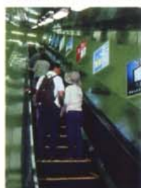
江ノ電エスカー 山頂まで運んでくれる 貸切バスで新横浜へ

いつまでも昭和であるような毎日がお祭りのような、いつかどこかで見た風景。サザエやハマグリを売る横をすり抜け、土産物屋に饅頭屋、射的のある遊技場を横目で見ながらゆっくりと歩を進める。呼び込みの声と蚊取り線香の匂いに、懐かしい夏の日が蘇る。ここに流れる空気は紛れもなく昭和そのものだ。