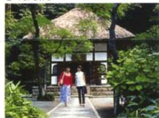
四季の花木で埋め尽くされる境内