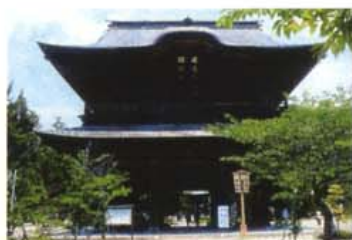
鎌倉五山筆頭の風格を伝える臨済宗建長寺派の総本山。伽藍が一直線に並ぶ典型的な禅宗様式を残している。