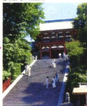
源氏の氏神であり、鎌倉の中心としていつも賑わっている。