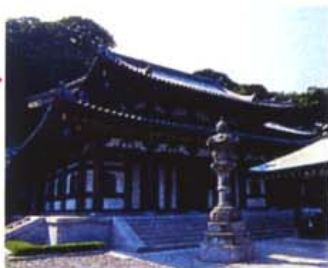
巨大な木造の十一面観音像で知られる寺。長谷観音の名で親しまれている。