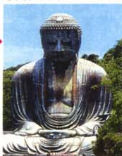
ご存知、鎌倉のシンボル。