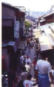
懐かしいことが詰まっている仲見世通り