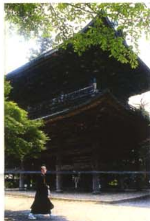
臨済宗円覚寺派の総本山で、鎌倉五山第二位の名刹。杉林に囲まれた境内全域が国の史跡に指定され、静寂な中に清々しい雰囲気漂う。